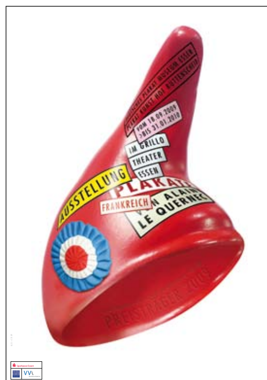
Ausstellungsplakat von Alain Le Querrec (Internationaler Plakat Kunst Hof Rüttenscheid Preis 2009)